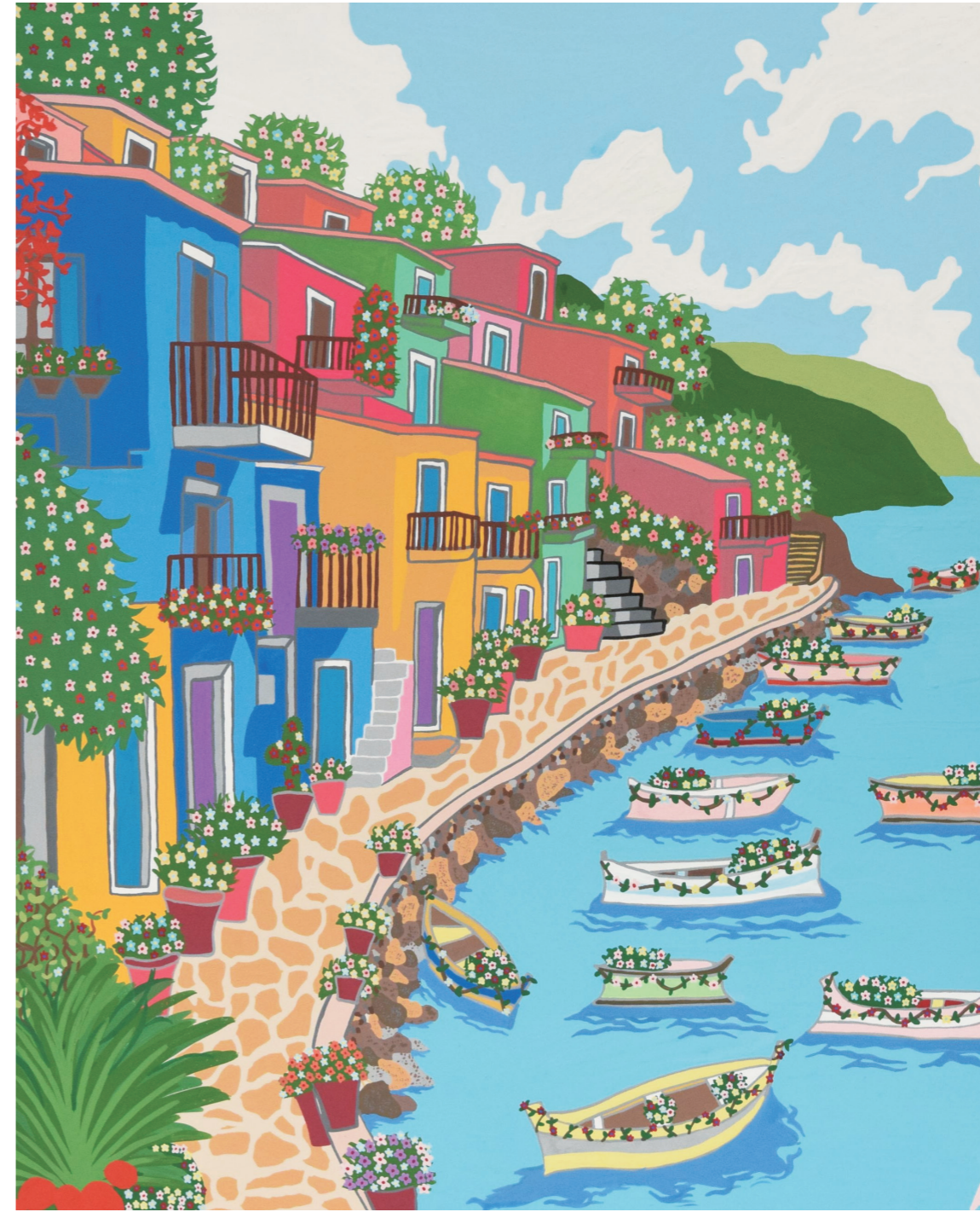
「カラフルなりゾート地」作:西川 愛美咲 ©株式会社バソナハートフル・アート村 ※株式会社バソナハートフル・アート村の障害のある社員の絵画作品