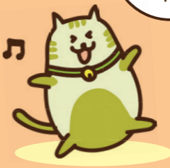
東京しごとセンター多摩 公式イメージキャラクター しごとたまちゃん