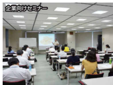
企業向けセミナー