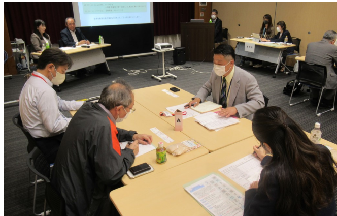
◀ 第二部 意見交換会の様子